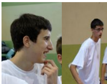
Projecció: Guillem Vives / Aitor Gómez