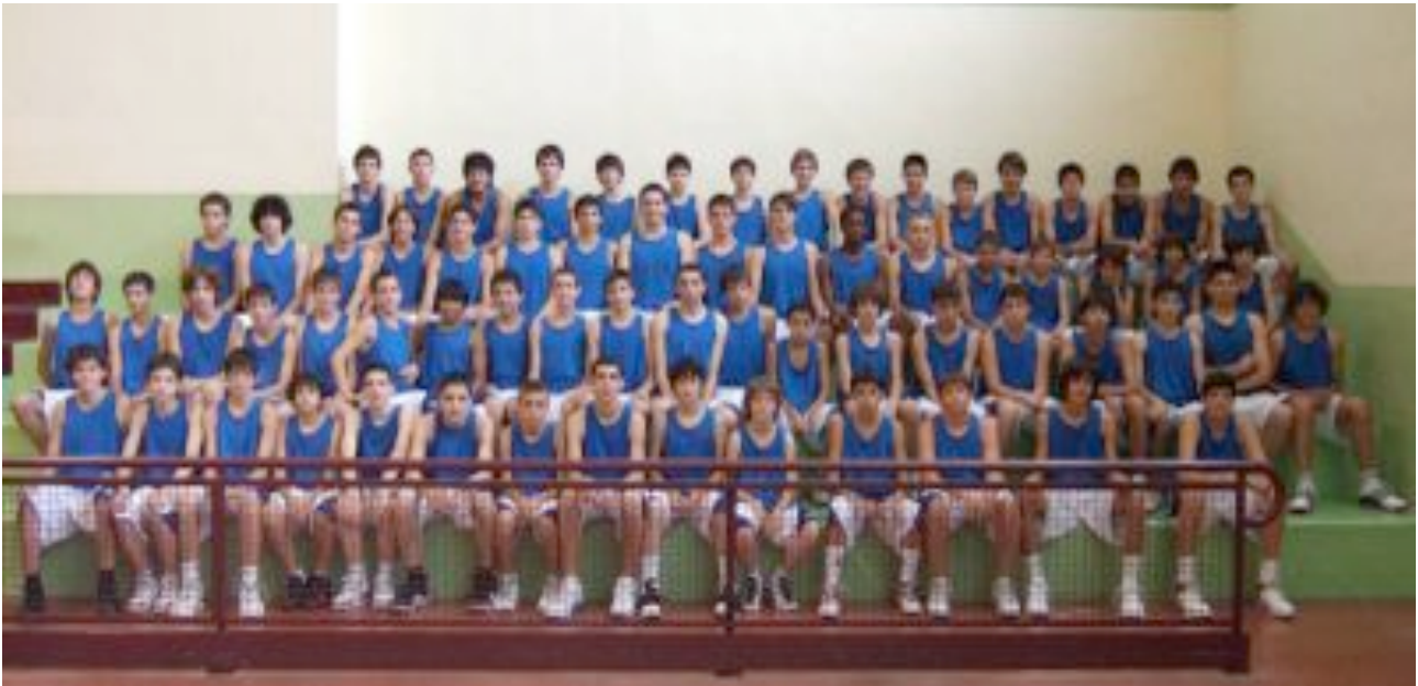
Jugadors Primer Torn