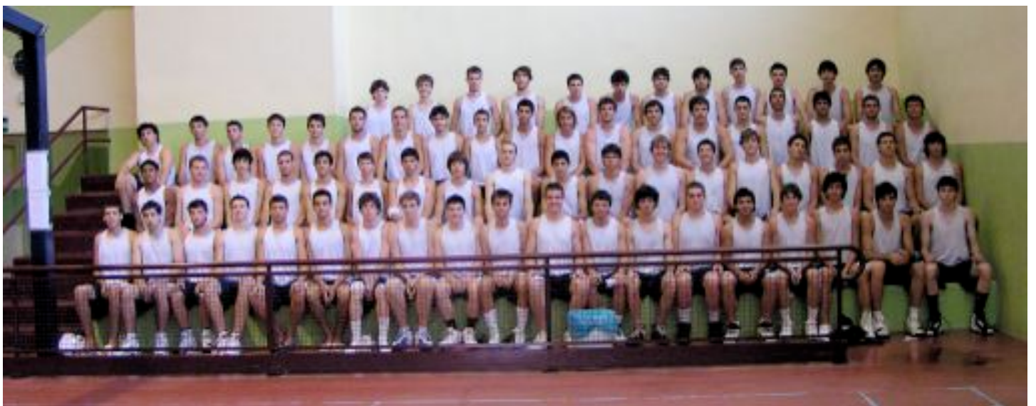
Jugadors Tercer Torn