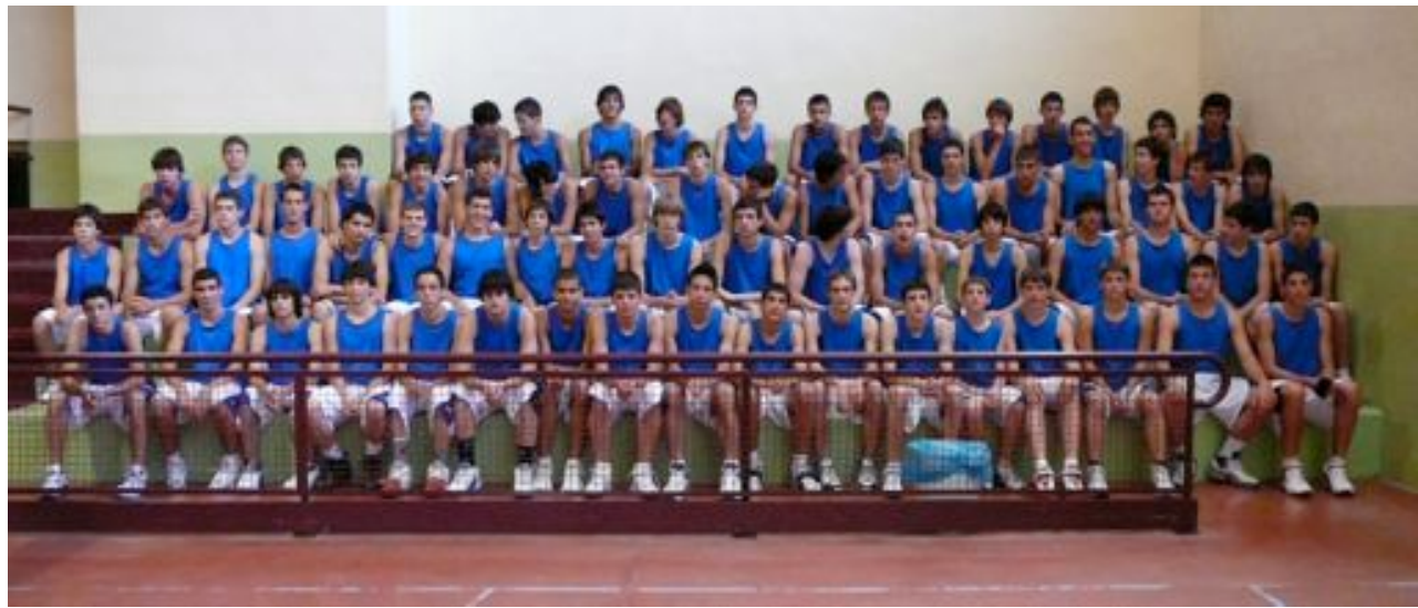
Jugadors Segon Torn