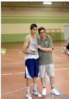
Projecció: Gerard Colome