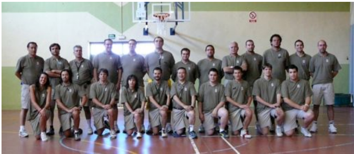
Entrenadors Segon Torn