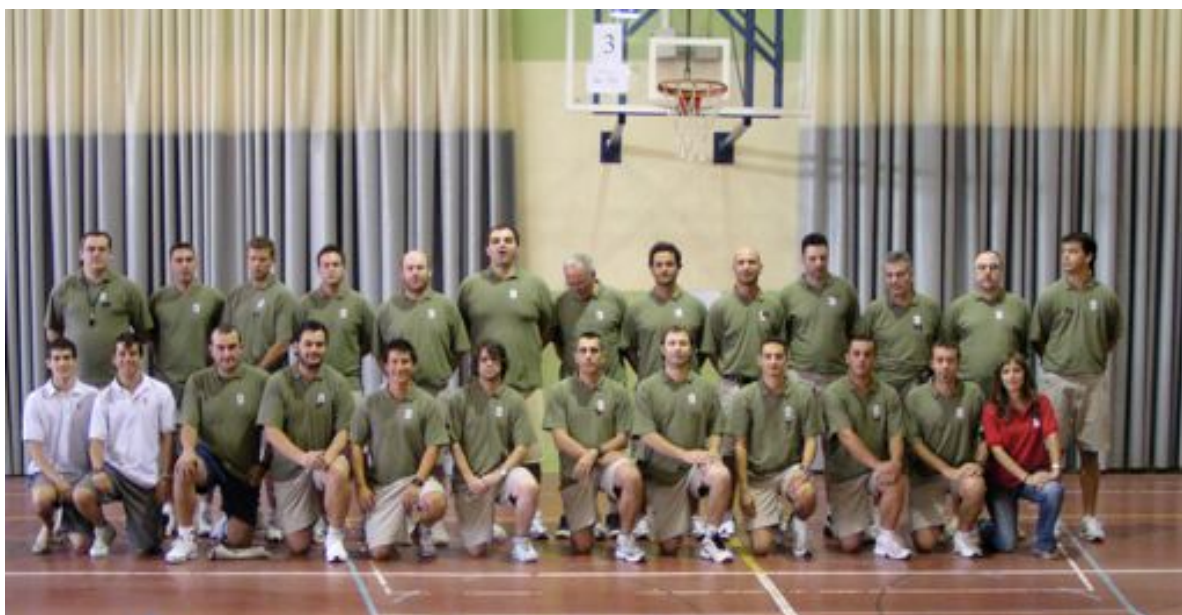
Entrenadors Tercer Torn