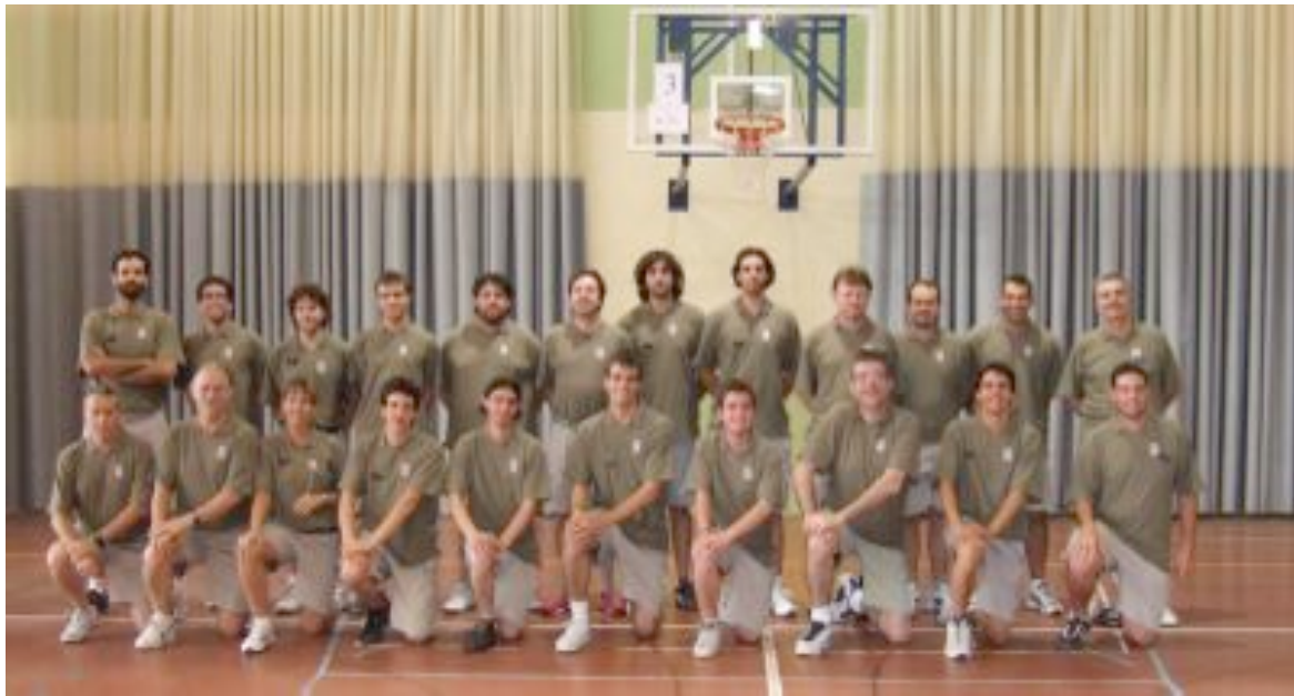
Entrenadors Primer Torn