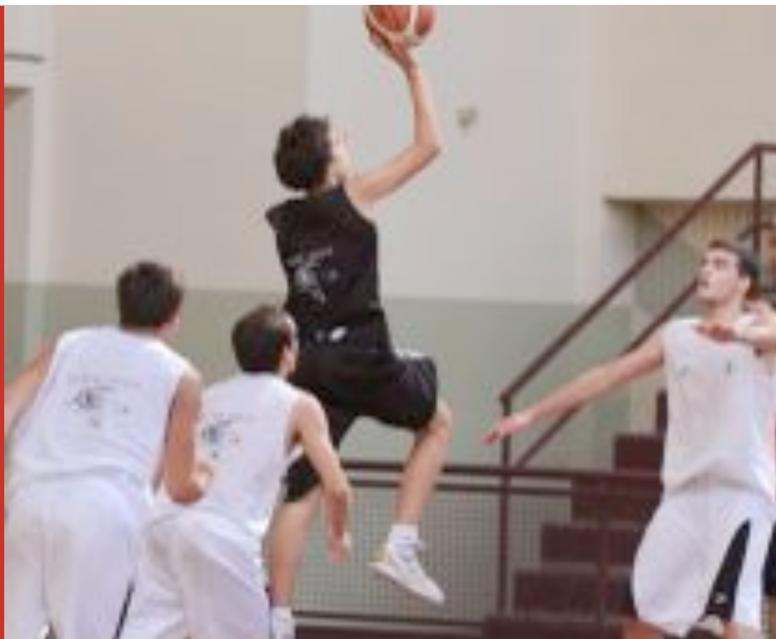
Una imatge d'un dels partits del Tercer Torn