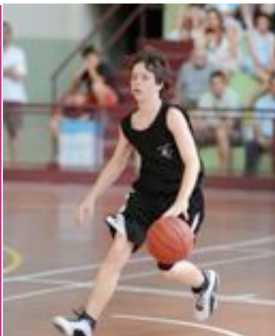
Imatges del Primer i Segon Torn

S'han celebrat també diverses xerrades i taules rodones entre els entrenadors de l'Estada i els diferents convidats que ens han visitat.